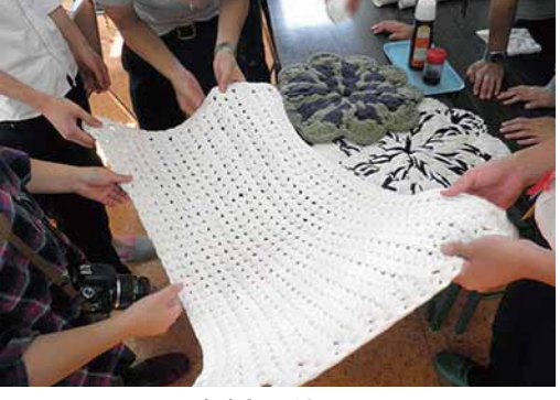
廃材を使ったハンモック