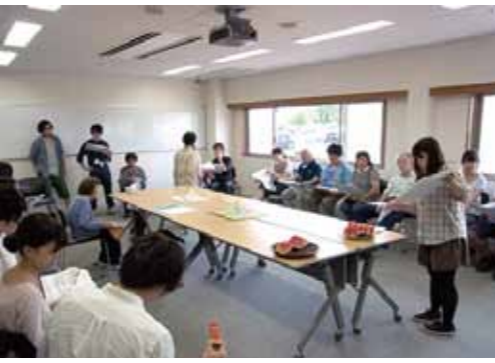
ハンモック案発表